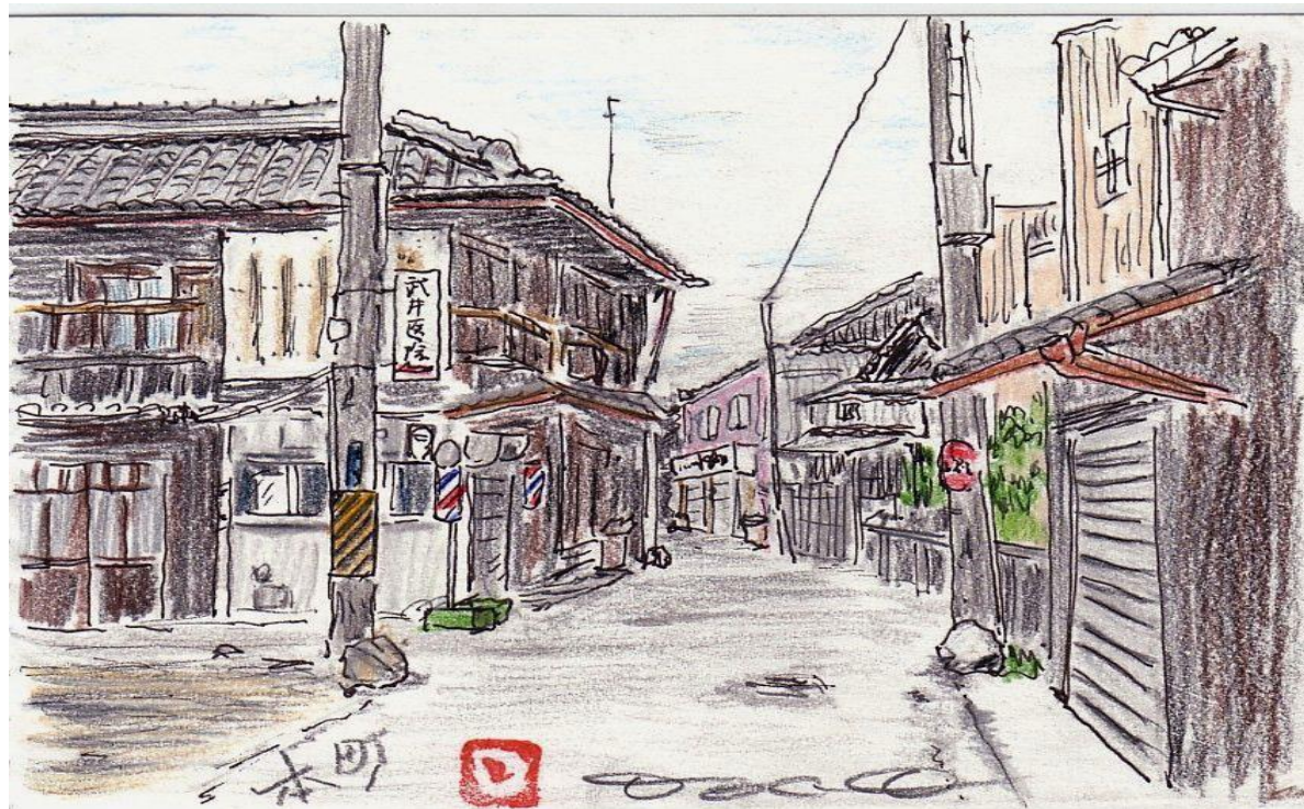
泉 佐 野 市