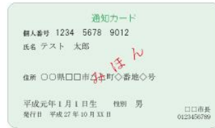
(表面) 通知カード (裏面)