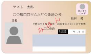
(表面) 個人番号カード (裏面)