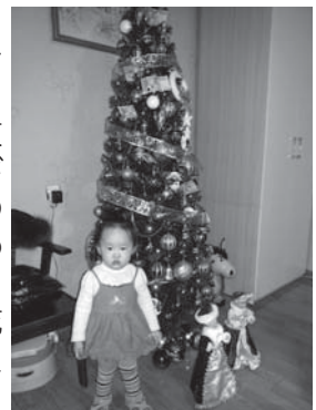
◀モンゴルの家庭でのクリスマスのような様子

今月のモンゴル語 баяр хүргэе (バヤル フルゲイエ)：おめでとうございます