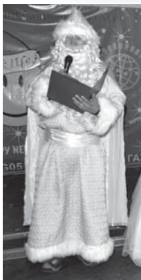
▶モンゴルの冬おじいさん (サンタクロース)