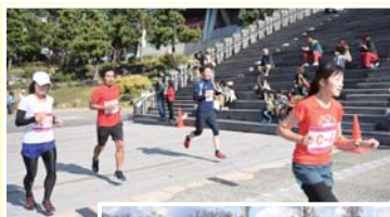
◀市民健康マラソン