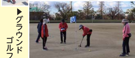
▶グラウンドゴルフ