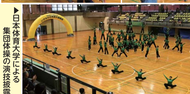
▶日本体育大学による 集団体操の演技披露