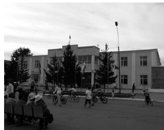
▲ズーンモド市の市章と市役所