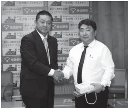
▲表敬訪問で握手する市長と知事

トゥブ県には41人の県議員がおり、そのうち8人が知事と昨年3月に泉佐野市を訪問しました。また、今年5月には知事と7人の県議員が泉佐野市を訪問し、市役所への表敬訪問、泉佐野市内の視察、関空マリーナからの体験乗船などに参加し、帰国されました。