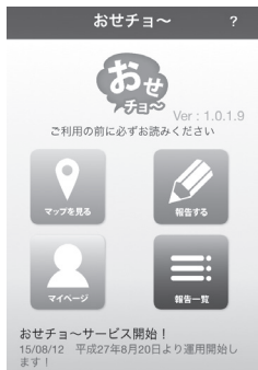
▲アプリトップ画面

問合先 市民協働課 (ホームページ: https://izumisano-osechou.com/ ) ※利用方法など、詳しくはホームページをご覧ください。