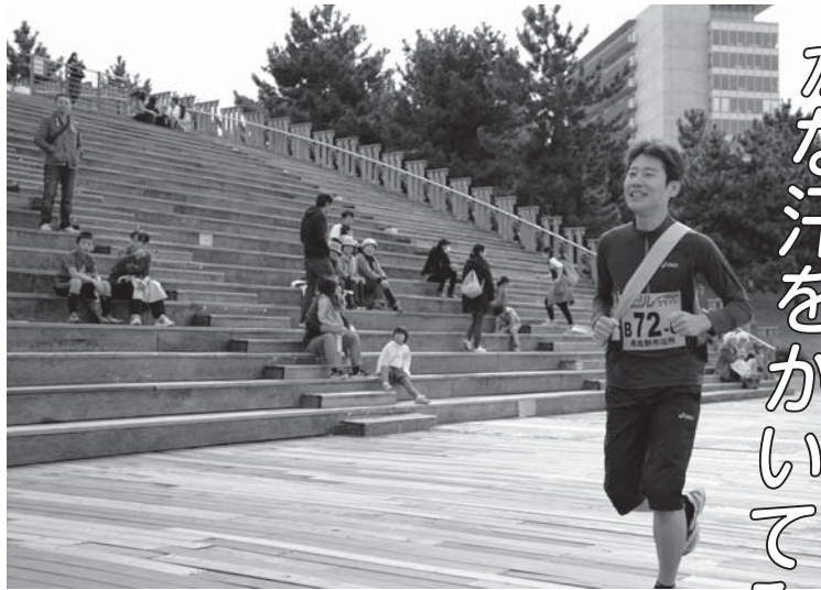
▶りんくうリレーマラソン▶

泉佐野市は、「市民の健康なまちいずみさの」をめざしており、スポーツの推進にも力を入れています。市民のみなさんも、心地よい潮風をあびて、マールビーチや緑地、海に沈む夕日などを眺めながら、マラソンやジョギングなどをしてみませんか?