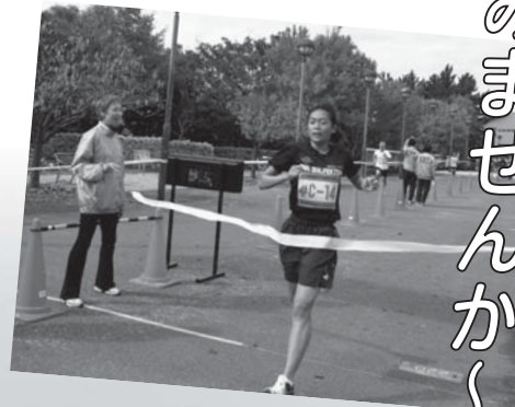
▶泉佐野市民健康マラソン大会▶