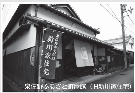
泉佐野ふるさと町屋館 (旧新川家住宅)