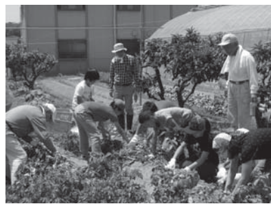
▲じゃがいも掘り体験

「いずみの森」ボランティア ～里山の自然の中で、一緒に心地よい汗を流してみませんか？～