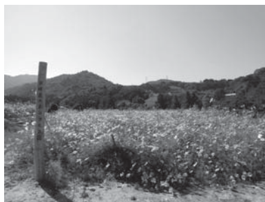
◀▲昨年度のコスモスの様子