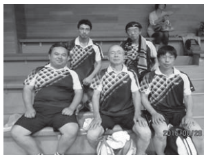
▲大阪府総合体育大会 卓球Ⅱの部チーム