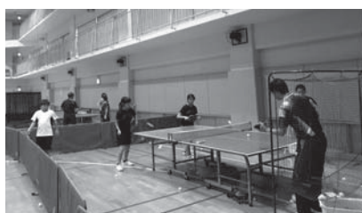
▲オークアリーナでの練習風景