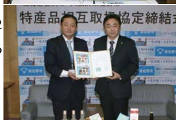
1月23日(月) 北海道登別市