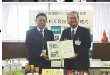
1月31日(木) 茨城県栗東市