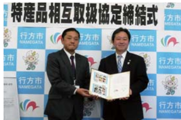
1月24日(火) 茨城県行方市

このような環境のもと、本市では、お互いの特産品を相互に取り扱い、全国に共同で情報発信することを目的として、他市と「特産品相互取扱協定」の締結をすすめています。