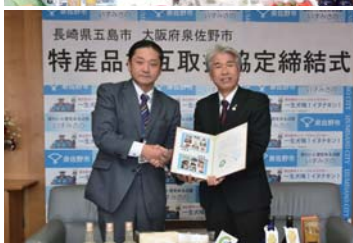
1月26日(木) 長崎県五島市