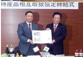
12月26日(月) 福島県相馬市