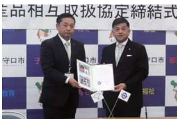
12月16日(金) 大阪府守口市