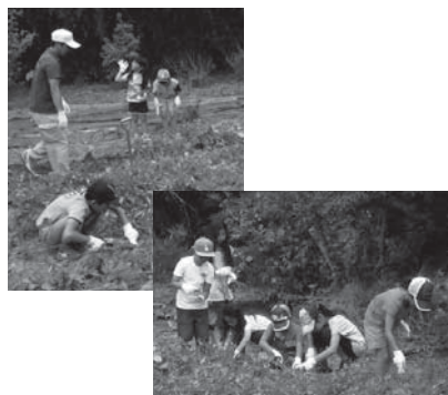
▲じゃがいも掘り体験