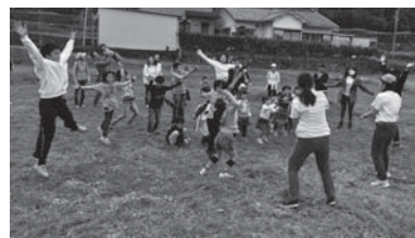
▲「ワクワクふれあいハイキング」で子ども達とゲームをしているジュニアリーダー達