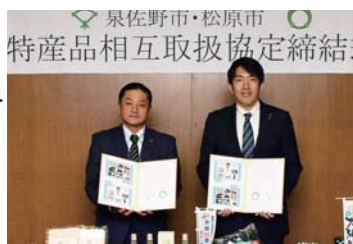
2月20日金 大阪府松原市