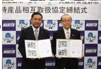
3月18日出 千葉県成田市