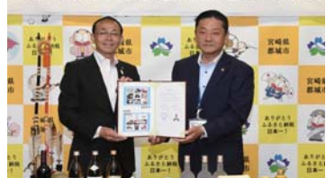
5月10日水 宮崎県都城市