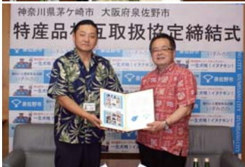
3月30日木 神奈川県茅ヶ崎市