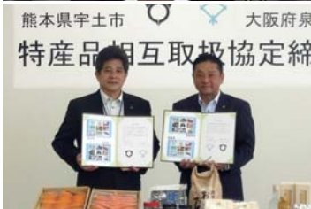
5月10日水 熊本県宇土市