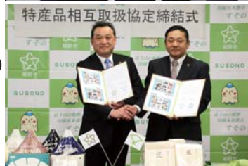
4月5日水 静岡県裾野市