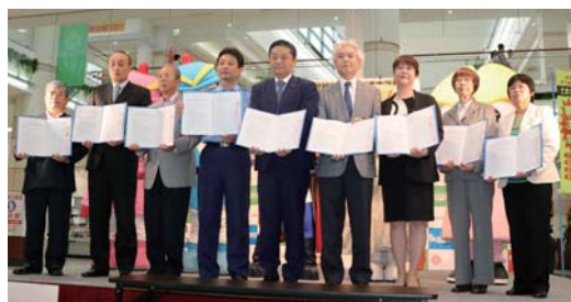
▲6月29日(木)、いこらも～る泉佐野 1階イベント広場において協定の締結式が行われました。

「泉佐野市特殊詐欺被害防止対策協定」の締結式を開催 本市は、社会福祉法人泉佐野市社会福祉協議会、泉佐野市民生委員児童委員協議会、泉佐野商工会議所、泉佐野市町会連合会、大阪タオル工業組合、泉佐野警察署、泉佐野警察署管内防犯協議会、泉佐野警察署管内事業所防犯協会と特殊詐欺の被害防止対策に関する協定を締結しました。 この協定は、市民の平穏な生活に大きな影響を与えている特殊詐欺の被害について、官民が一体となって、特殊詐欺被害防止のための広報啓発、特殊詐欺被害防止機器の普及促進など、実効ある被害防止対策に取り組み、市民が安心して暮らせるまちづくりを推進し、安全な市民生活を確保することを目的とします。