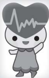
▲泉佐野保健所 脳卒中予防キャラクター