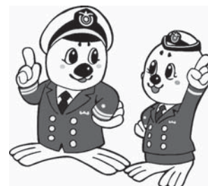
▲海上保安庁キャラクター「うみまる」と「うーみん」

問合先 海上保安庁学生採用ホームページ( http://www.kaiho.mlit.go.jp/ope/saiyou/bosyu.html )または第五管区海上保安本部総務部人事課(☎078-391-6556)