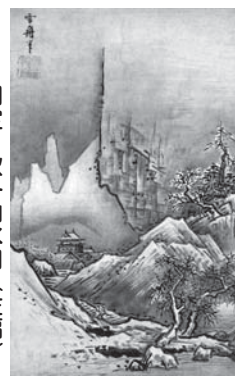
▶国宝 秋冬山水図(左幅) 雪舟筆 2幅のうち室町時代15世紀 東京国立博物館(展示期間…I・II期)

※受講無料。1人の申込で2人まで参加できます(整理券は1枚につき1人入場可)。詳しくは、ホームページをご覧ください。