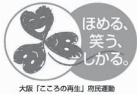
大阪「こころの再生」府民運動

府民一人ひとりが「生命を大切に にする」「思いやる」「感謝する」 「努力する」「ルールやマナーを 守る」など、時代や社会がどの ように変化しても決して忘れて はならない大切な「5つのこころ」 を見つめ直し、「あいさつす る」など身近な取り組みを実践す ることを呼び かけています。