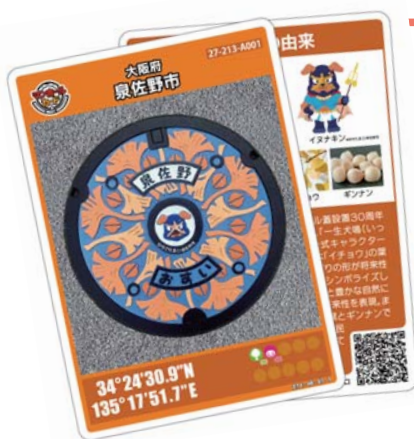
▲マンホールカード

また「泉佐野マンホールカード」を入手した人限定で、「りんくうまち処」で使用できる特産品割引券も併せて配布しています。