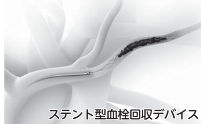
ステント型血栓回収デバイス

動脈硬化や心臓でできた血塊（血栓）が原因で脳血管が閉塞し、脳に血液が届かなくなり壊死してしまう「脳梗塞」。脳梗塞を発生してすぐの治療として、rt-PA（組織プラスミンノゲン活性化剤）の使用開始（2005年）から10年以上が経過し、いろいろな問題点が出てきています。最も問題なのは時間の制限で、発症から45時間以内に治療を開始しないと間に合いません。抗凝固剤（血をサラサラにする薬）を内服中や過去の脳出血・肝不全の患者さんには使用できないなどの制限もあります。一方、2013年頃から新しい脳梗塞治療が開発されました。その代表的なものが「ステント型血栓回収デバイス」です。これは閉塞した脳血管にステントと呼ばれる網目状の筒を挿入し、血栓を絡め取って血管を再開通させるといったものです。この装置を使用すると80%以上の例で再開通が認められ、発症から8時間まで治療が可能です。既往歴や内服薬の制限も少なく、rt-PA治療適応外の患者さんの中でも、使用できる場合が多くあります。当院ではいち早くこの治療法を取り入れ、今では大阪府内で五指に入る症例数を誇るまでになっています。当院では患者さんの状態に合わせて、最も適切な医療を提供するように努めています。脳梗塞を疑う症状があれば、たとえ時間が経っていても諦めずに救急車を呼んでください。これまで以上に回復するチャンスが広がっています。