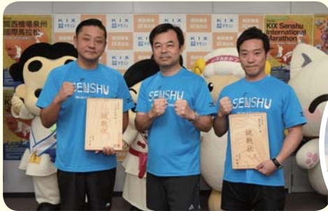
▲左から千代松市長、辻市長、南出市長