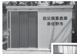
◀◀防災備蓄倉庫(写真左)と備蓄資機材(写真右)

毛布、簡易トイレ、炊き出しかまど、発電機、ダンボールベッド、ブルーシート、ロープ、スコップなど