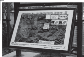
▲大木小学校内の看板