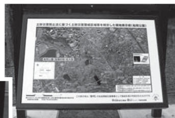
▲船岡公園内の看板