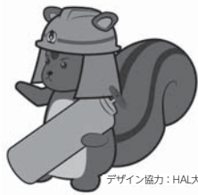
デザイン協力：HAL大阪

ごみ置き場や建設現場、空地などに投棄されているボンベや、長期間使用されていないボンベは危険です。ボンベの中には、高い圧力のかかったガスが入っています。ボンベが錆びていたりすると強度が低くなり、少しの衝撃で破裂する恐れがあります。みなさんの身の回りも、今一度確認してください！