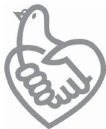
条例啓発シンボルマーク