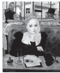
▲「カフェ」1949年油彩・カンヴァス ボンビッドラー・センター（フランス・パリ）蔵 ©Fondation Fujita/ADAGP,Paris&JASPAR,Tokyo,2017 E2833

田嗣治展」係へ。受付後に入場整理券を郵送します。 ※受講無料。1人の申込で2人まで参加できます（整理券は1枚につき1人入場可）。詳しくは、ホームページをご覧ください。