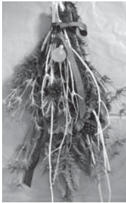
※見本と若干異なることがあります。