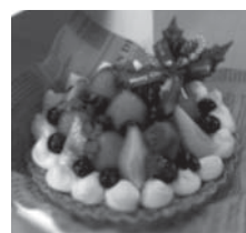
※見本と若干異なることがあります。