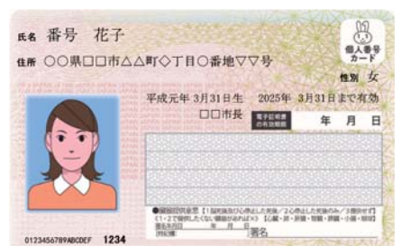
▲マイナンバーカード見本

本人が病気、身体の障害などのやむを得ない理由により、市役所に来ることが困難な場合に限り、代理人にカードの受取を委任できます。その場合、本人確認書類・本人からの委任状・代理人の本人確認書類の他に、診断書・本人の障害者手帳・本人が施設などに入所している事実を証する書類を持参してください。(仕事・学業が多忙なため本人が来庁できないなどの理由は、やむを得ない理由には該当しません。)