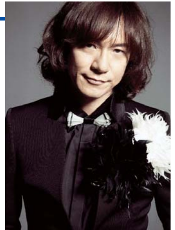
▲ダイヤモンド☆ユカイ

※詳しくはホームページ（ http://izumisanosyouhi.com ）をご覧ください。