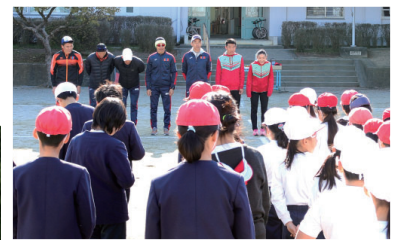
▲2月28日(金)、佐野台小学校の児童とリレーや体操などで交流