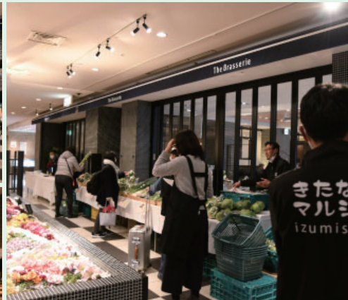
※2月15日(土)、きたなかマルシェのみなさんによる野菜販売のようす