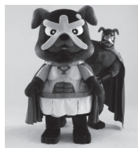
▲ゆるナキン (左) ▲イヌナキン (右)