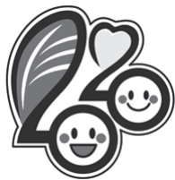
▲2020年記念 バッジデザイン