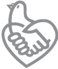
条例啓発シンボルマーク