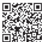
▲プレ講座申込QRコード