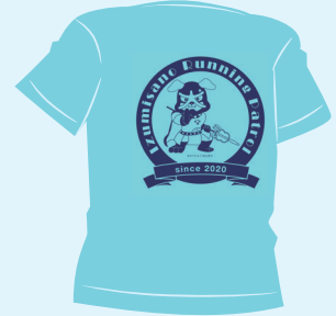
▲ランニングウェア (イメージ)