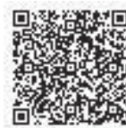
▲それって依存症？ QRコード

☎0570・061・999 開設日 毎週土・日曜日 午後1時～5時 問合先 府 地域保健課 (☎06・6944・7524)