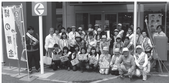
▲みどりの募金活動（イオンモール日根野店）