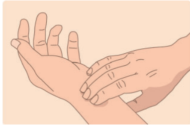
▲「心房細動週間ウェブサイト」より

泉佐野保健所管内の泉佐野市、熊取町、田尻町、泉南市、阪南市、岬町の3市3町では脳卒中予防対策に取り組んでいます。 問合せ先 健康推進課