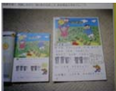
拡大写本は拡大コピーではありません

拡大写本の文字は、書き方が細かく決められています。また、子どもたちの見え方に応じて文字の太さや大きさを決めるので一字一字が手作業です。