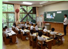
【少人数授業の様子】

少人数ならではの落ち着いた雰囲気、一人ひとりの特性に応じた学習を進めています。主体的な学びの充実などを目標に、学習指導の工夫を行っています。(1学年定員16名)