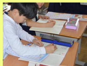
【自分の考えを持つ】

一人学習と班学習を組み合わせ、友だちと意見交流し、自分の考えをより深める活動を大切にしています。また、書く力や表現力・観察力を培うために日記を書く学習に取り組んでいます。