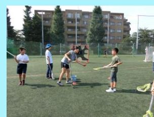
【日本体育大学訪問】