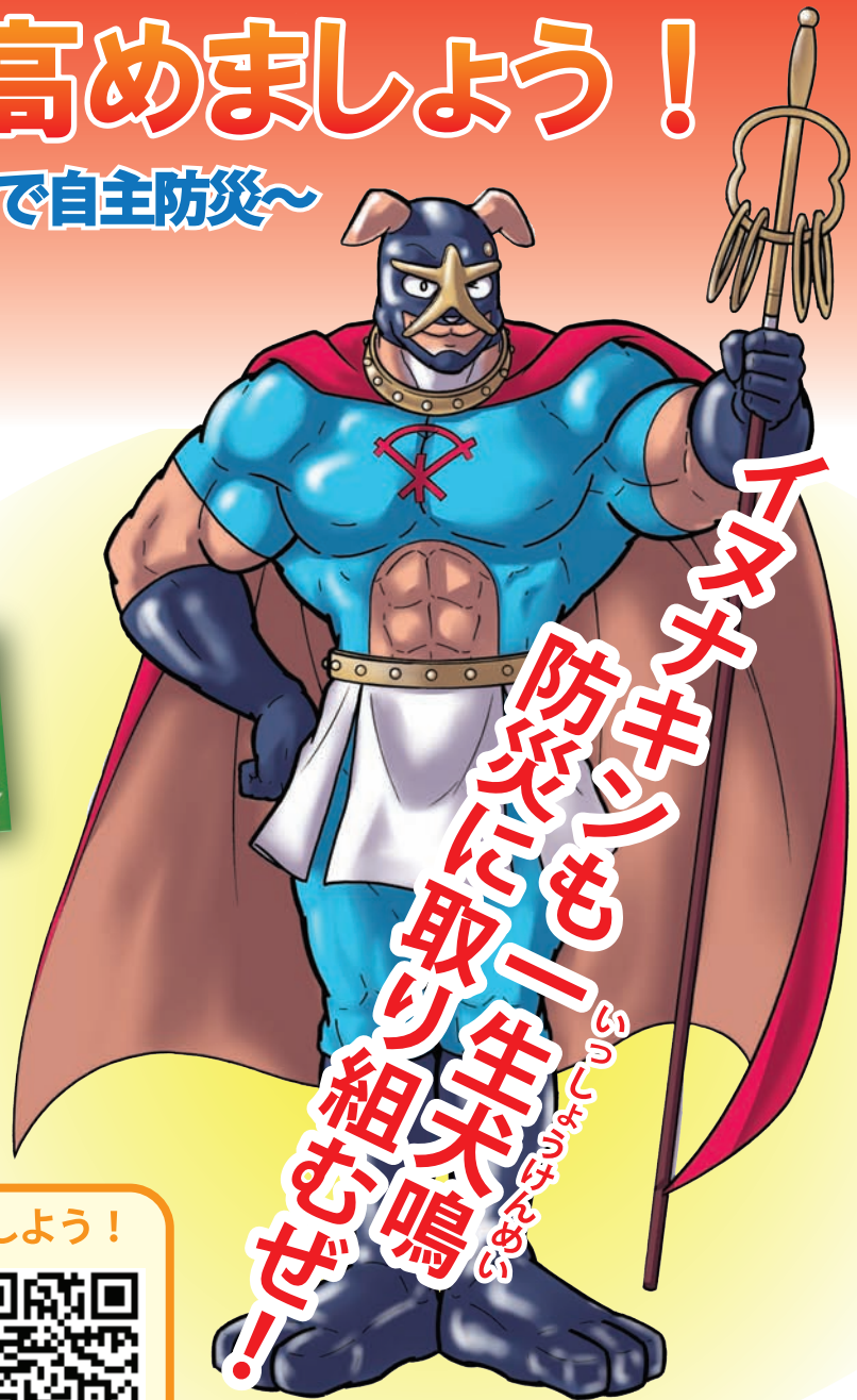
▲泉佐野市のイメージキャラクター イヌナキン

ステッカーをご家庭やお店、会社に貼って、みんなで防災意識を高めましょう。また、このステッカーは、スマートフォンアプリと連動し、避難場所への誘導もしてくれるなど、いろいろな機能がありますので是非、アプリも試してみてください。