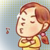
介護・監護の 放棄・放任