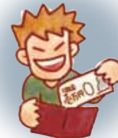
経済的虐待 (金銭の無断使用など)