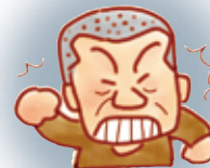
身体的虐待 (殴る・蹴るなど)