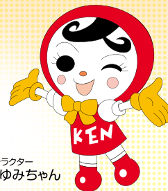
人権イメージキャラクター 人 KEN あゆみちゃん