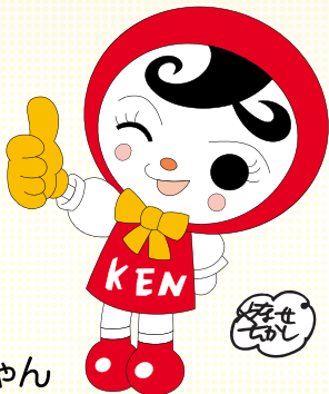
人権イメージキャラクター 人 KEN あゆみちゃん

※人権擁護委員とは、法務大臣が委嘱した民間の人たちで、約14,000名が全国の市町村に配置されています。