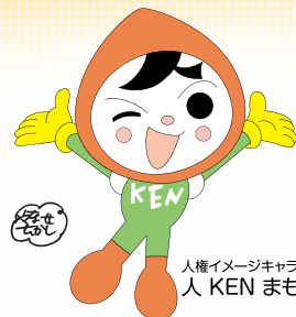
人権イメージキャラクター 人 KEN まもる君