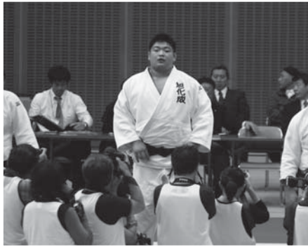
▲講道館杯全日本柔道 体重別選手権大会