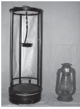
▶あんどんとランプ