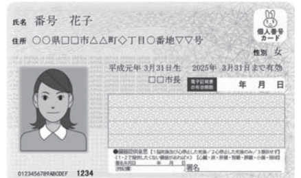
▲マイナンバーカード見本

本人が病気、身体の障害などのやむを得ない理由により、市役所に来ることが困難な場合に限り、代理人にカードの受取を委任できます。その場合、本人確認書類・本人からの委任状・代理人の本人確認書類の他に、診断書・本人の障害者手帳・本人が施設などに入所している事実を証する書類を持参してください。（仕事・学業が多忙なため本人が来庁できないなどの理由は、やむを得ない理由には該当しません。）