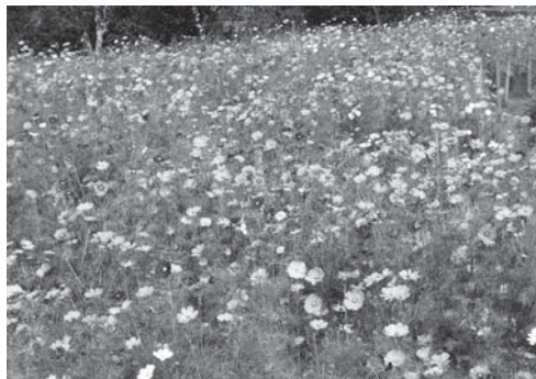
▲昨年度のコスモスの様子