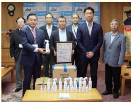
▲感謝状贈呈式 7月17日(金) 株式会社 グリース 様