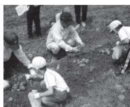
▲ジャガイモ掘り体験