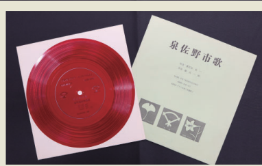
▲「泉佐野市歌」のレコード