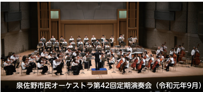
泉佐野市民オーケストラ第42回定期演奏会（令和元年9月）

このプロジェクト、まだやっと一歩踏み出したばかりです。まだコロナ禍が落ち着いていない状態なので、とりあえず次の段階としては、まず市民オーケストラで録音をしたいです。その次に、泉佐野市少年少女合唱団をはじめ市内の合唱団に協力してもらい、合唱プラスオーケストラの音源を作りたい。そして最終形として、どこかの演奏会で、市民オーケストラの演奏に合わせて合唱団や会場の人たちみんなが歌ってもらえたらいいなと思っています。