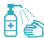
手指消毒用アルコールによる消毒の励行